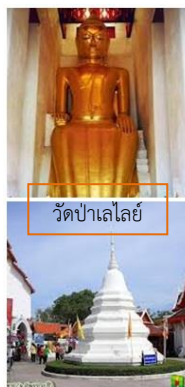
วัดป่าเลไลยก์