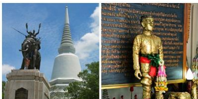
อนุสรณ์สถานดอนเจดีย์