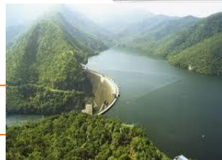
เขื่อนกำแพงแสน